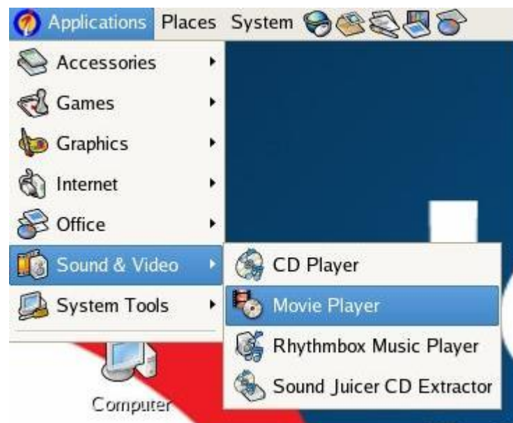
Gambar 4.3 Menu Movie Player