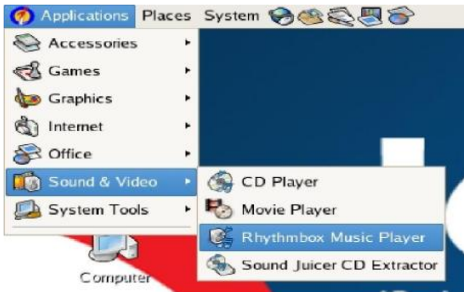
Gambar 4.1 Menu Rhythmbox Music Player