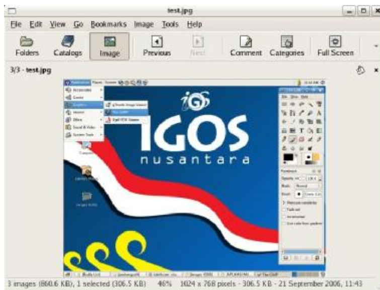
Gambar 4.6 Menampilkan Gambar