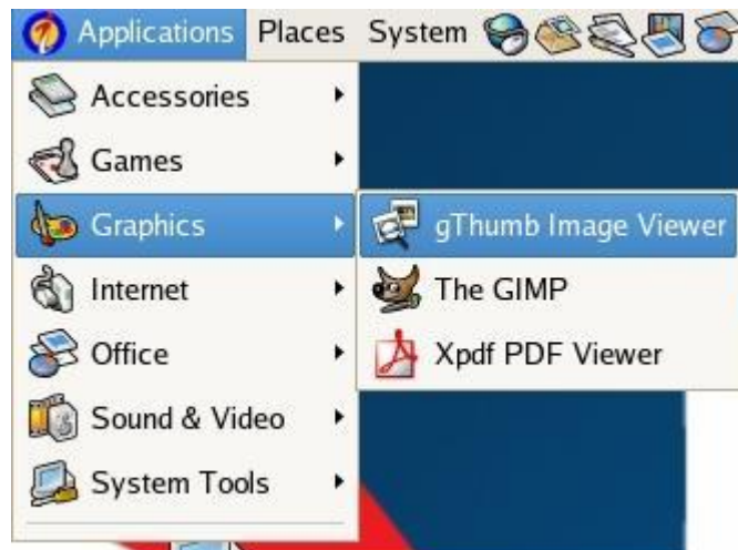
Gambar 4.5 Menu gThumb Image Viewer