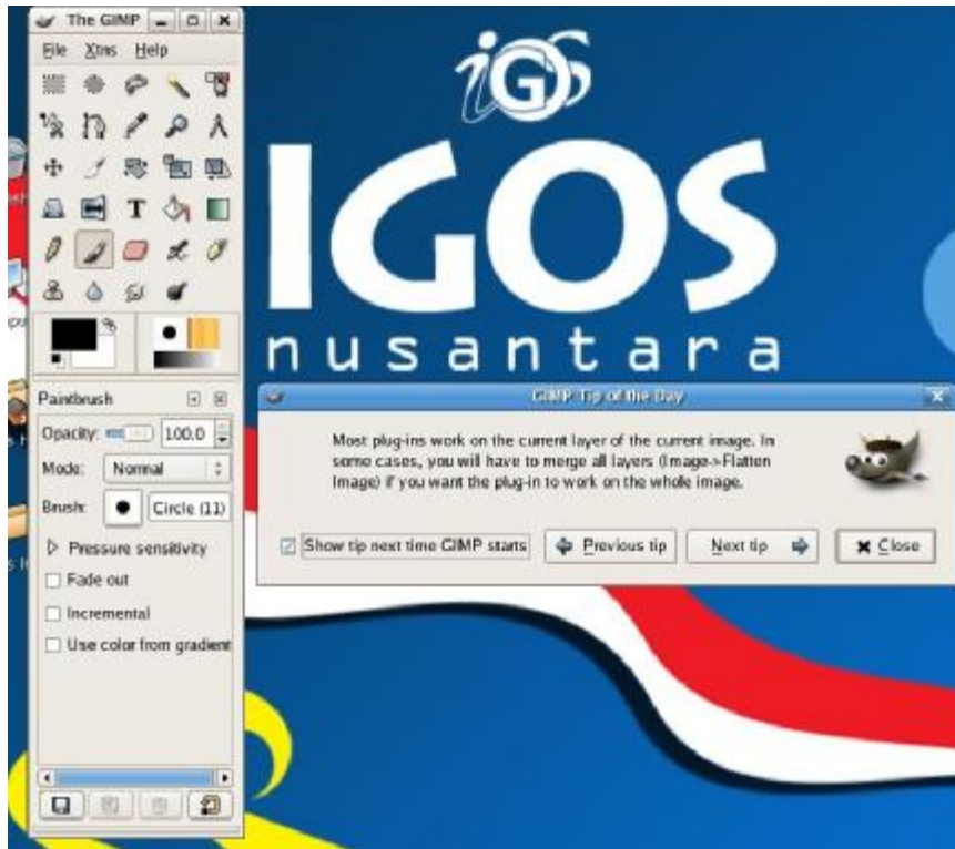
Gambar 4.8 The GIMP