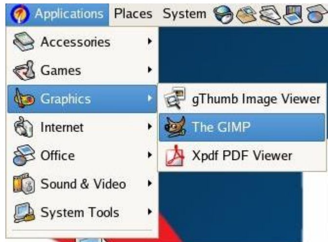
Gambar 4.7 Menu The GIMP