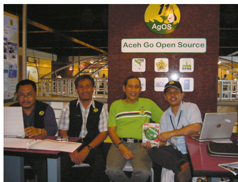
Foto komunitas Aceh di stand AGOS Ritech Expo 2007.