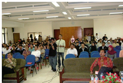
Foto peserta seminar Linux di Bontang.