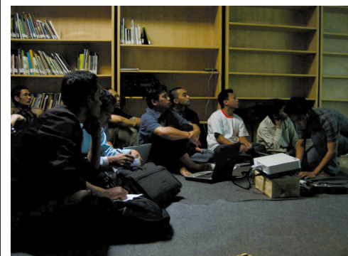
Foto suasana santai, tapi serius di KPLI Bogor.