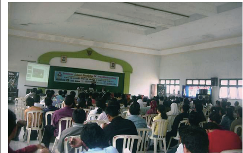
Foto seminar KPLI Kediri dan Awali Jatim.