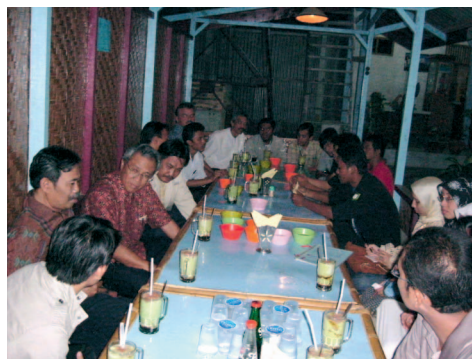
Pertemuan komunitas Linux Aceh dengan Menristek.