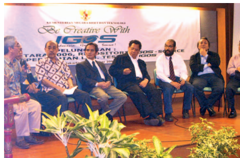
Konferensi pers IGOS Nusantara 2006 bersama para pejabat Kominfo, Ristek, LIPI, yang didukung Sun Microsystems dan Intel.