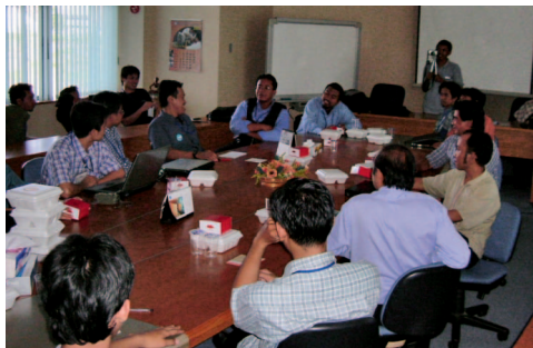
Suasana pertemuan KPLI seluruh Indonesia - santai tapi serius.

Acara yang disebut sebagai "KPLI Meeting" pertama ini bertujuan untuk berbagi pengalaman dalam